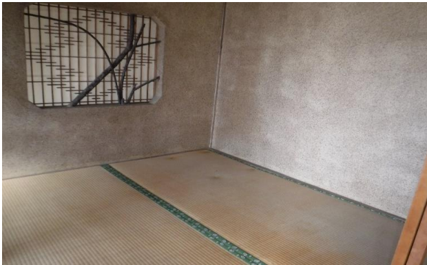
1F 和室 ②