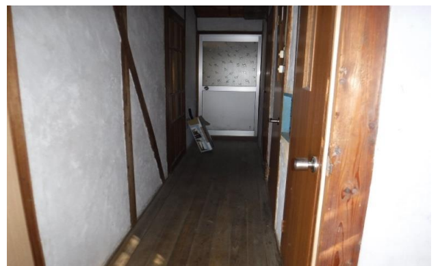
1F 廊下 ⑩