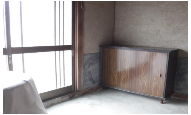
1F 玄関 ① (2)