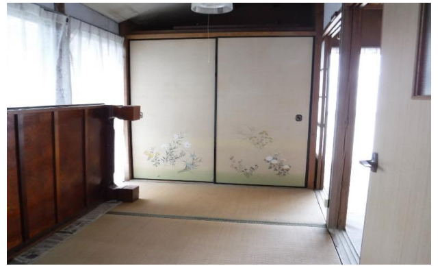
1F 和室 ⑤