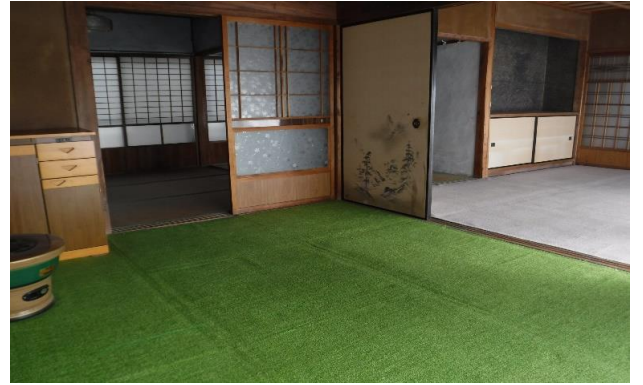
1F 和室 ③