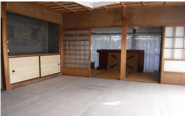
1F 和室 ④