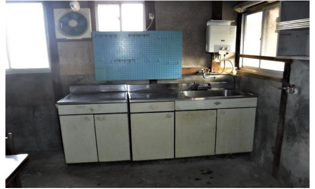
台所 ⑮ (2)