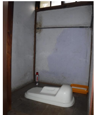
1F トイレ ⑫