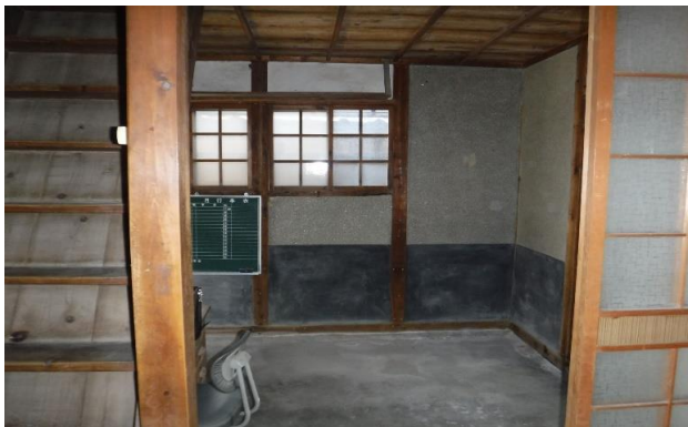
1F 土間 ⑥ (1)