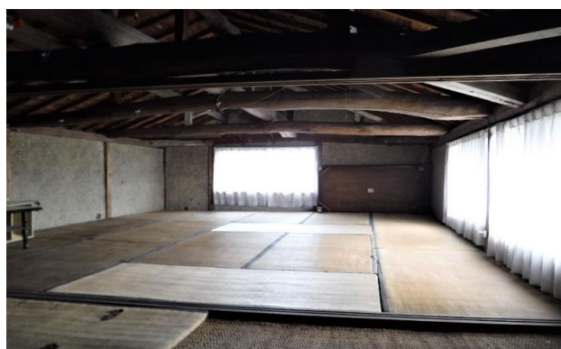
2F 和室(物置) ⑬