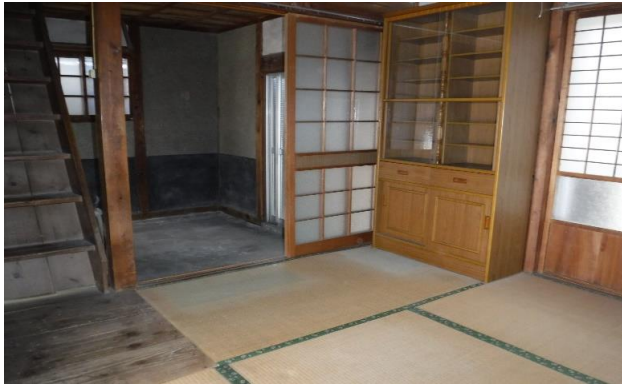
1F 和室 ⑦