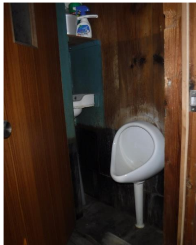
1F トイレ ⑪