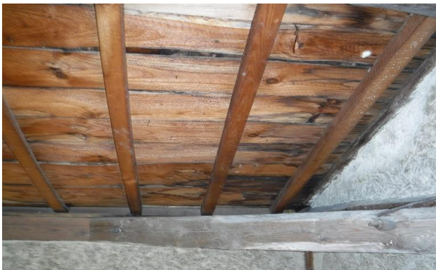
2F 天井 シミ