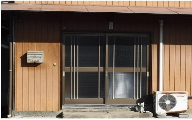
1F 玄関 ① (1)