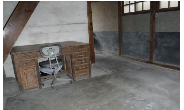
1F 土間 ⑥ (2)