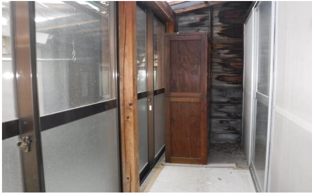
1F 廊下 ⑨