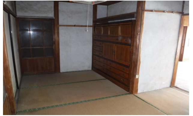
1F 和室 ⑧