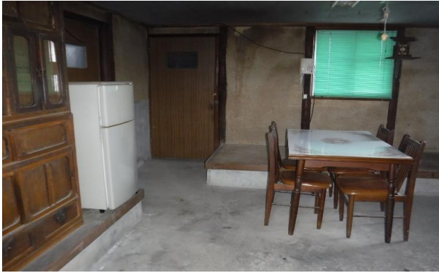
台所 ⑮ (1)