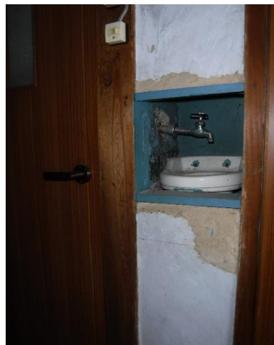
1F 手洗い ⑪