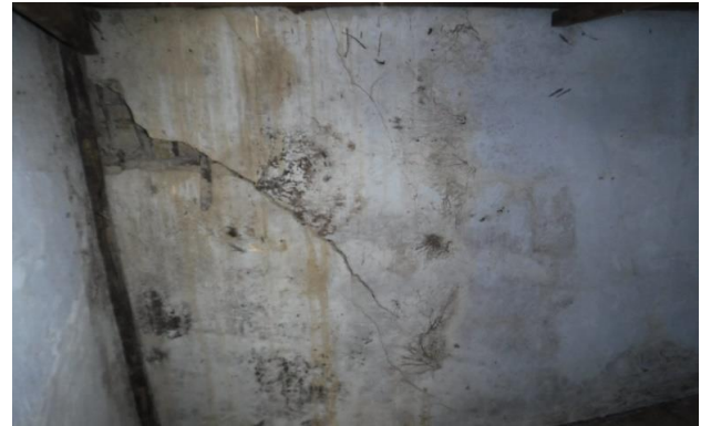
1F 押入 壁 雨漏り跡・隙間