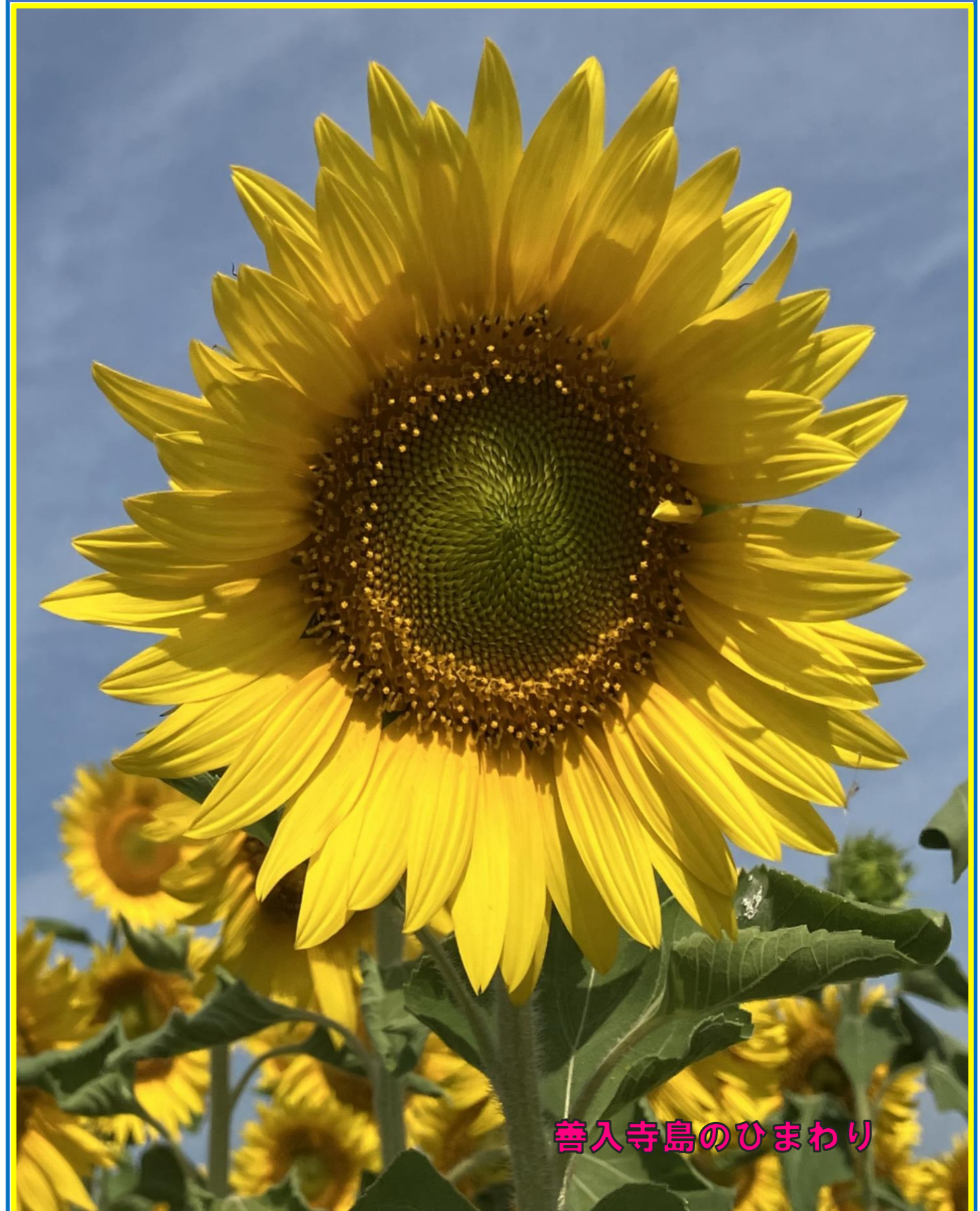
善入寺島のひまわり